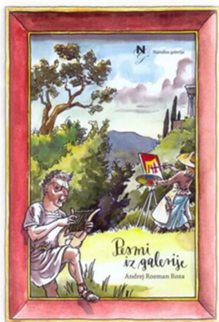
Slika 21: Letošnja darilna knjiga za »zlate bralce«.

Ob zaključku bralne sezone je Društvo prijateljev mladine Koper ob pomoči MOK organiziralo zaključno prireditev za Zlate bralce. Letošnji trije zlati bralci so se udeležili zaključne prireditve, ki je potekala v dvorani Frančiška Asiškega v Koprju, kjer so si ogledali nastop uličnega gledališča Lastniki humorja. Zlatim bralcem smo priznanja in knjižno nagrado (Pesmi iz galerije) podelili na valeti.