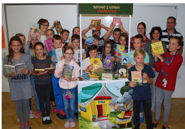
Slika 8: Navdušeni šestošolci pred začetkom bralnega projekta.

Uspešno smo sodelovali v bralnem projektu Berimo z Rovko Črkolovko. Petošolci so dosegli 11. mesto, šestošolci pa 3. mesto. Med 10 najboljših bralcev se je uvrstil 1 učenec. Sedmošolci so sodelovali v projektu Rastem s knjigo in osmošolci na KD: Branje je potovanje (oboje z namenom spodbujanja branja pri učencih tretje triade).