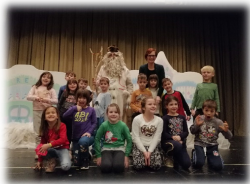
Slika 18: Obisk dedka Mraza.

Ob koncu bralne sezone so ob pomoči MO Koper organizirali prireditev za Zlate bralce.