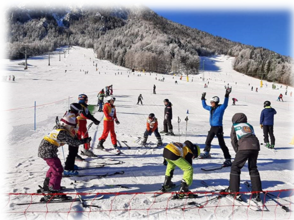
Slika 3: Šestošolci in petošolci se učijo smučati.