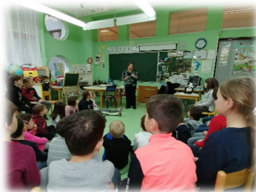
Slika 14: Naša bivša učiteljica na obisku.

Starši so tudi sodelovali, ko je na šoli potekal PEŠ BUS.