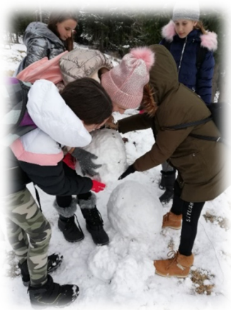
Slika 2: Šestošolke postavljajo snežaka.

Kljub ne preveč naklonjenemu vremenu je bil tečaj alpskega smučanja uspešno izveden, saj so vsi učenci osvojili osnovno smučarsko znanje, spretnejši so se lahko preizkušali v nadaljevalnih oblikah smučanja. Poleg alpskega smučanja so učenci spoznali tudi nekatere na okolje vezane naravoslovne, družboslovne in športne vsebine, večerni čas pa je bil namenjen predvsem druženju, sprostitvi in zabavi.