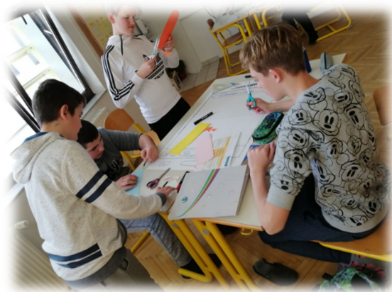
Slika 25: Skupinsko delo