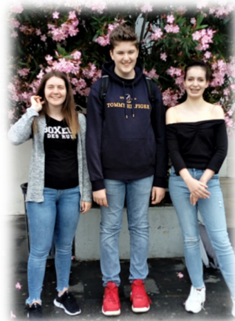
Slika 22: Naši zlati bralci.