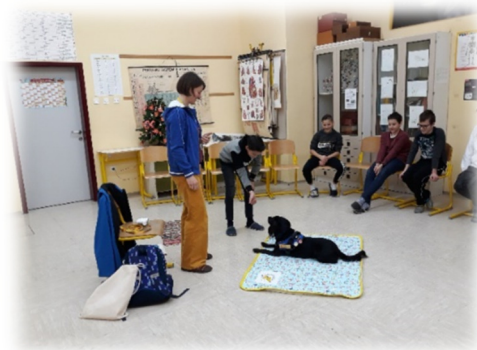
Slika 23: Kuža na obisku

9. 1. 2020 smo za učence 7. c razreda organizirali kulturni dan z naslovom Rastem s knjigo. Prvi dve šolski uri sta bili na obisku psička Lia in njena vaditeljica, ki sta članici društva Tačke pomagačke. Predstavili sta jim način dela, njuno poslanstvo in izvedli nekaj preprostih vaj z učenci.