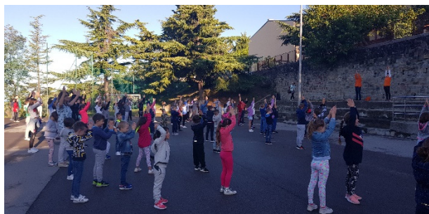
Slika 5: Jutranja telovadba

Projekt Tradicionalni slovenski zajtrk je bil tudi letos eden izmed osrednjih dogodkov dneva slovenske hrane, ki smo ga obeležili v petek, 15. novembra 2019. Gre za tradicionalen slovenski zajtrk, ki je sestavljen iz mleka, kruha, masla, medu in jabolka. Namen ukrepa je, da otroke, mladino in širšo javnost seznanjamo o pomenu zajtrka, pomenu in prednostih lokalno pridelanih živil, ki so pridelana oz. predelana v Sloveniji.