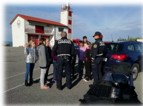
Slika 15: Izkustvene delavnice »Bodi previden«.

Tudi v tem letu smo sodelovali s Policijsko upravo Koper. Dejavnosti so se izvajale v okviru rednega pouka. V mesecu septembru so policisti PP Koper obiskali učence 1. razreda in jim predstavili varnost v prometu. Za učence 5. razreda je policist izvedel v mesecu decembru predavanje o nevarnostih petard. Učenci 4. in 5. razreda so se udeležili delavnic Bodi previden, ki jih je Policijska uprava Koper pripravila v sodelovanju z Gasilskim društvom Hrvatini in Zdravstvenim domom Koper.