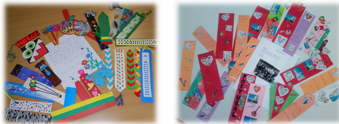
Slika 10, 11: Kazalke iz Litve in iz Portugalske.