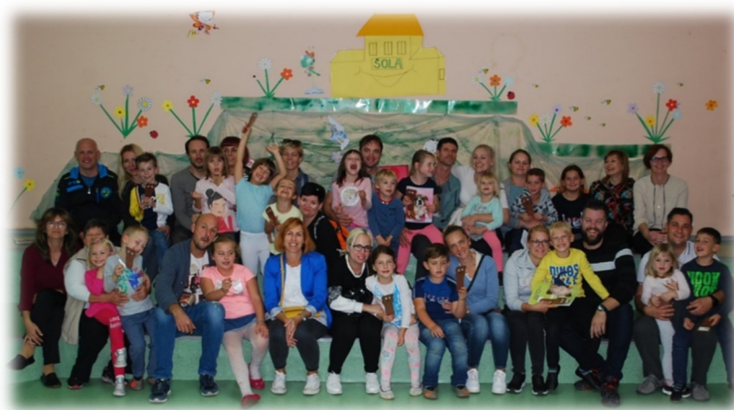
Slika 9: Sproščeni, nasmejani in ponosni po koncu bralno-ustvarjalnega dne.

Za učence prvošolce in njihove starše je bila organizirala bralna delavnica. Skupaj smo prebrali pravljico Prismoda neroda, nato pa so učenci uredili zvezek branja in poustvarjali po zgodbi, s starši pa smo vodili pogovor o pomenu zgodnjega, družinskega in skupnega branja. Nato so starši izdelali knjižne kazalke za svoje otroke, na katere smo nalepili njihove knjižnične izkaznice.