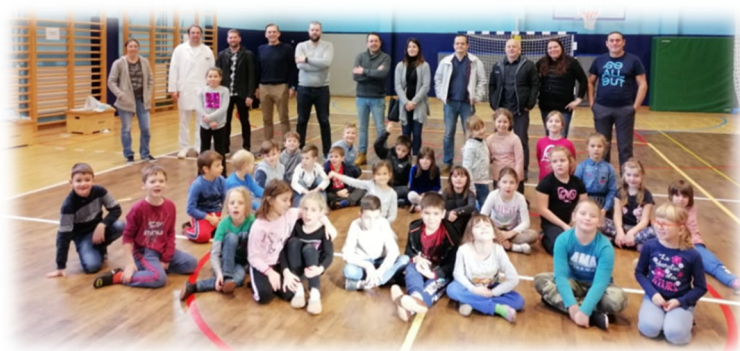
Slika 12: Starši predstavijo svoj poklic

V decembru so imeli učenci 1. triade naravoslovni dan Spoznavamo poklice. K sodelovanju smo povabili tudi starše, ki so se prijazno odzvali vabilu. Na naravoslovnem dnevu so se posamezni starši predstavili s svojim poklicem, učenci pa s ponosom opazovali in poslušali.