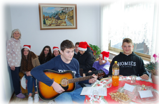
Slika 20: Devetošolci z upokoјenci

Devetošolci so v decembru v okviru projekta Pogum obiskali upokoјence. Učenci so za njih sami izdelali uporabno darilce, »termofor«. Izdelali so tudi voščilnice in jih priložili k darilcu. Upokoјenci so bili zelo veseli obiska. Pričakali so nas s pecivom in sokom. Mi pa smo jim praznično vzdušje pričarali s pesmijo.