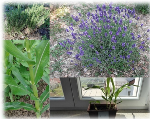
Slika 4: Na šolskem vrtu

Plane nam je porušila epidemija COVID-19. Učenci šestega razreda so tako dobili semena fižola in koruze, ki so jih postavili v ustrezne pogoje in spremljali njihov razvoj. Kalitve so bile zelo uspešne, a vendar zaradi epidemije vseh rastlin nismo uspeli presaditi v šolski vrt.