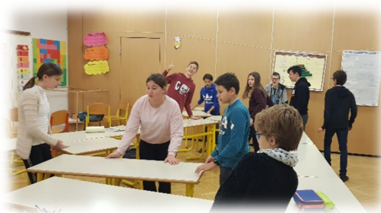
Slika 1: Učenci se učijo z gibanjem.

V prvih štirih mesecih so potekale ob začetku 5. ure, en dan v tednu, tudi fit stimulacije, nato pa so te minutke zvodenele. Prav tako se jih ni izvajalo v času karantene. Cilj je bil dosežen.