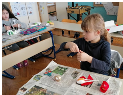
Slika 6, 7: Marjetko mobil in delavnica izdelave izdelkov iz odpadne embalaže

Na področju trajnostnega razvoja smo izvedli tudi naslednje dejavnosti: