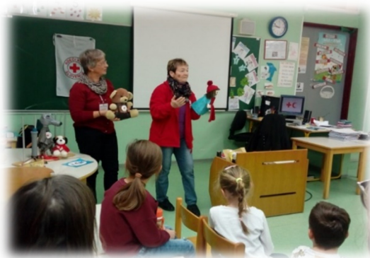
Slika 17: Lutkovna igrica Križem Kapica, 1. razred.